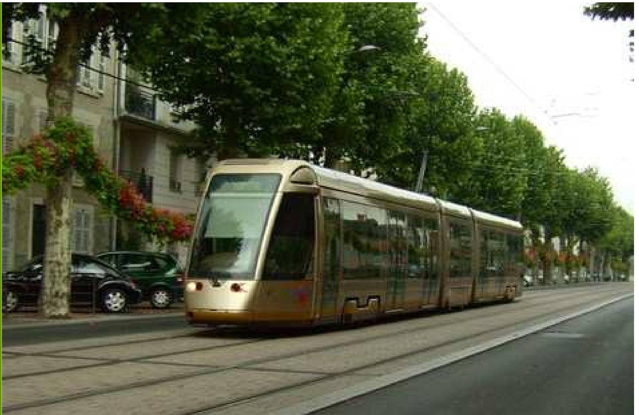
Straßenbahn in Orleans