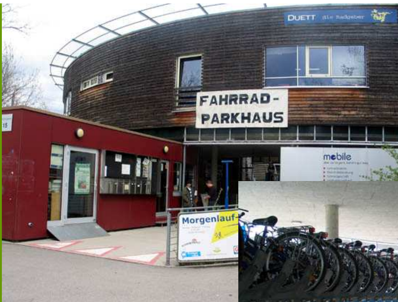
Fahrradparkhaus in Freiburg