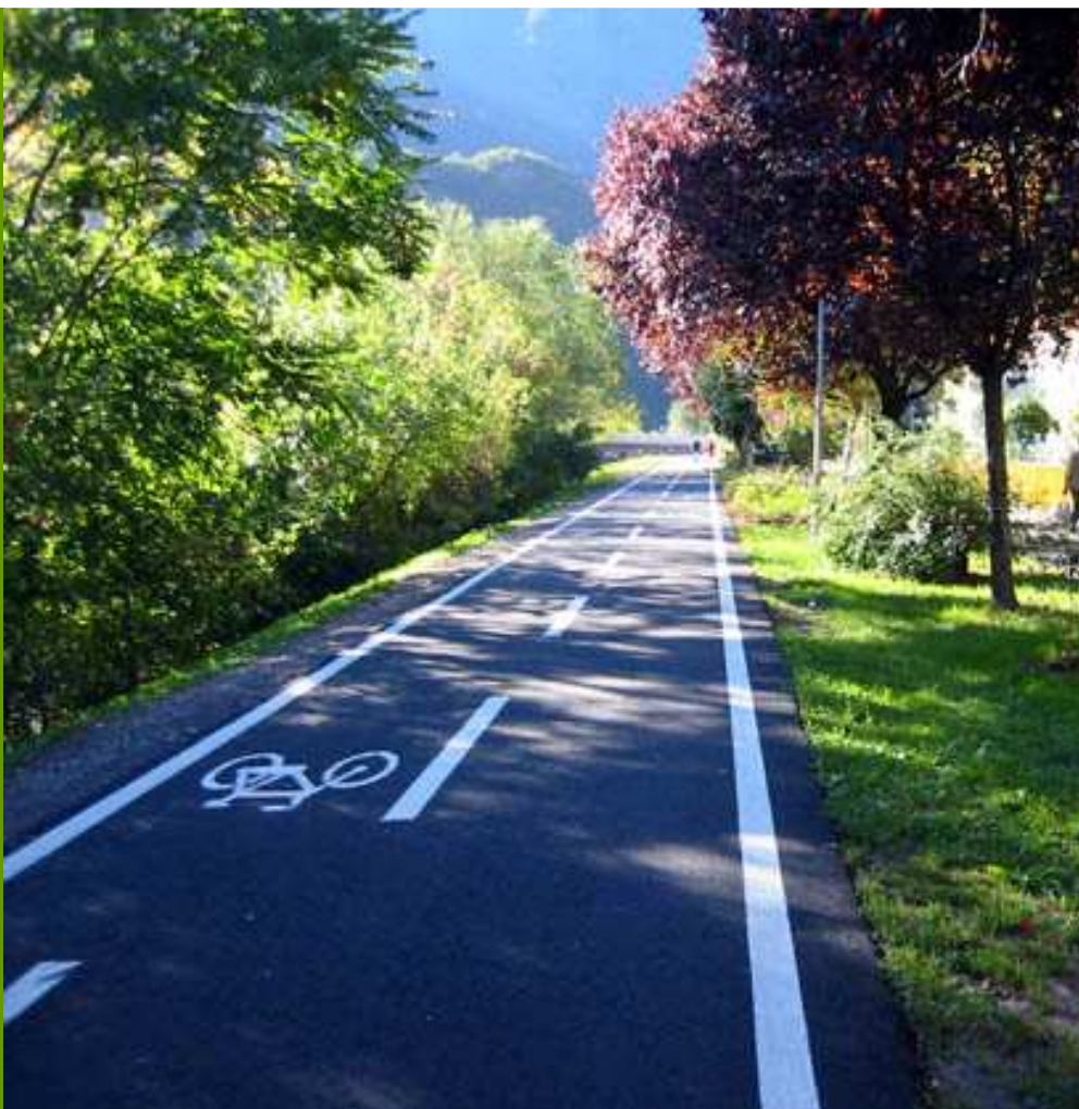
Fahrradstraße und gut gestaltetes Fahrradleitsystem in Bozen