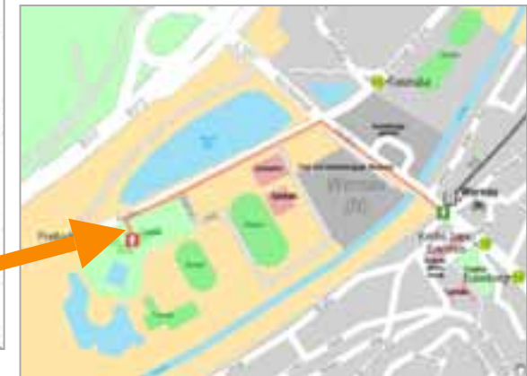
Karte mit Fußweg zum Ziel

Ähnliche Präsentation: Theaterangebot im VVS, geplante POI-Präsentation: Hotels